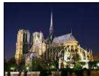
L' Ile de la Cité